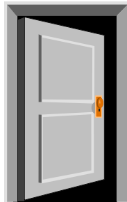
Fig.1.1. Puerta Gris

Para imágenes : debe hacer referencia al capítulo y al número correspondiente de la imagen. Ejemplo: