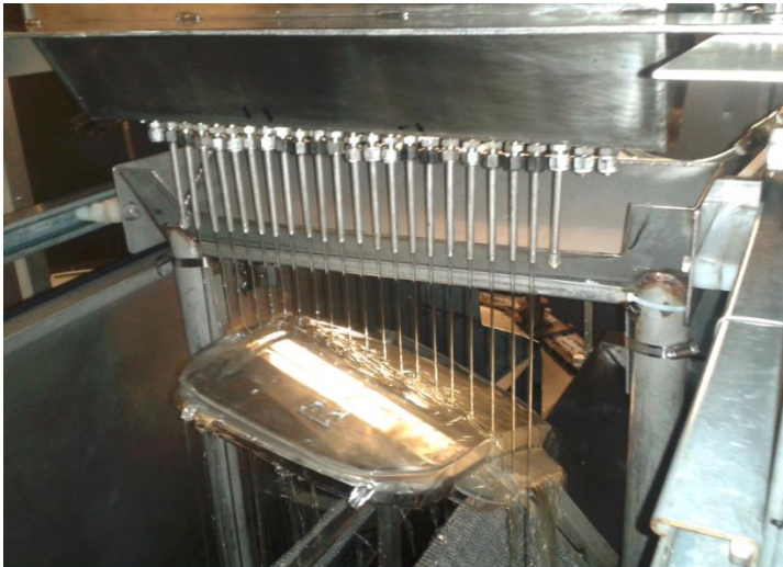
Proceso de Barnizado