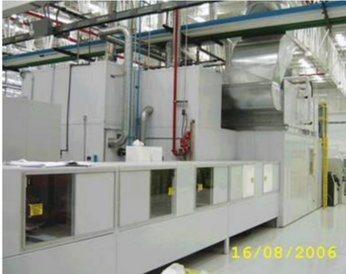
Barnizadora de flow coat