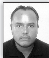
Orlando René Uribe Uribe