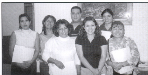
El personal sindicalizado que fue basificado recibió su nombramiento en las oficinas sindicales

con la misión por la cual ha sido creada; dar un servicio de calidad, a la sociedad queretana.