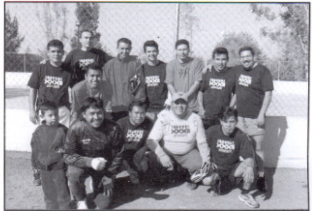
En Torneo Deportivo pasado se elevó la participación de los trabajadores

De esto último se tuvo que pedir un préstamo a la caja de ahorros del SUPAUQ por cien mil pesos para hacer frente a