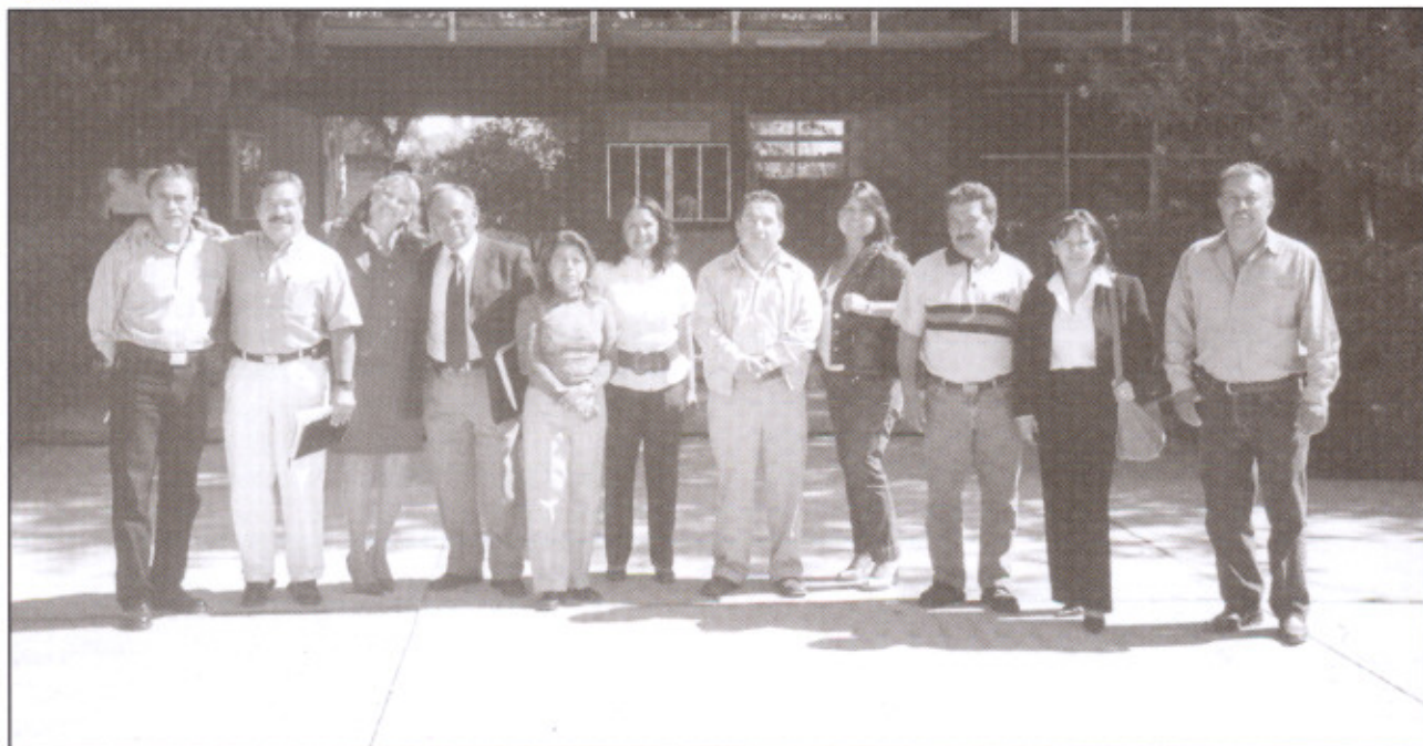
Representantes de la UAQ y del Sindicato en las instalaciones de la Preparatoria San Juan del Río

Esta Comisión ha organizado ya un viaje cultural a Bernal y terminado en el Balneario San Joaquín, en Ezequiel Montes, carretera a Tequisquiapan, el primer día de las vacaciones el 2 de abril del 2007, el cual se llevó con éxito y sin contratiempo.