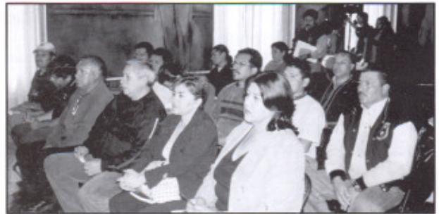
En las actividades sindicales, contamos con el acompañamiento de los compañeros delegados e integrantes de comisiones sindicales