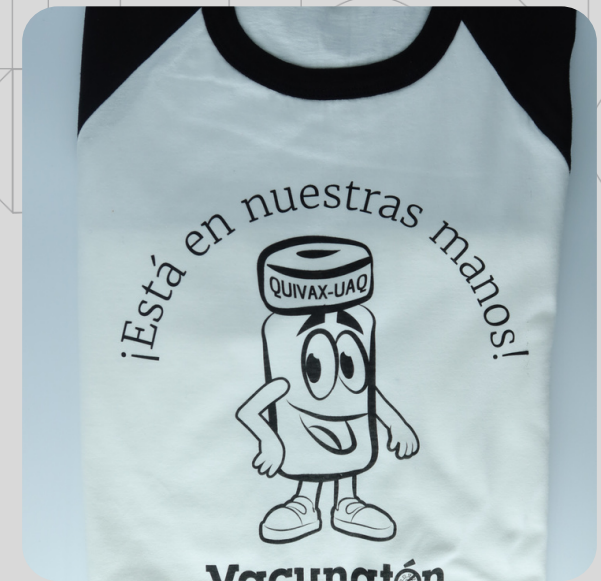
Modelo QUIVAX 17.4 Manga Negra