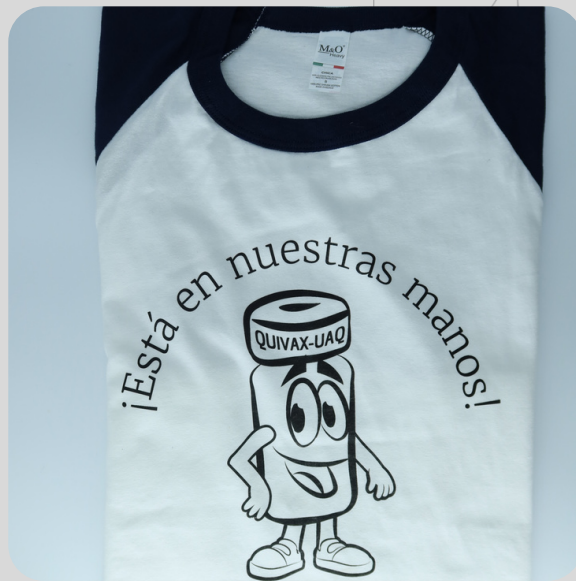
Modelo QUIVAX 17.4 Manga Azul