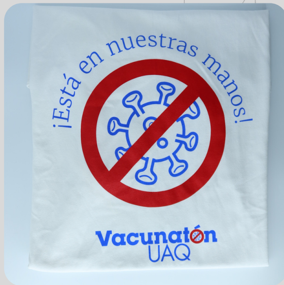
Modelo Coronavirus Blanca