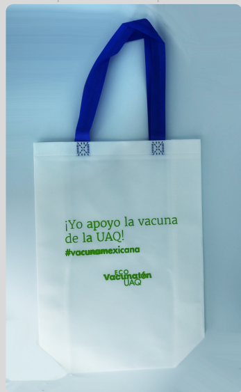
Bolsa Texto Verde