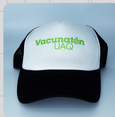
Adulto Negra Logo Verde