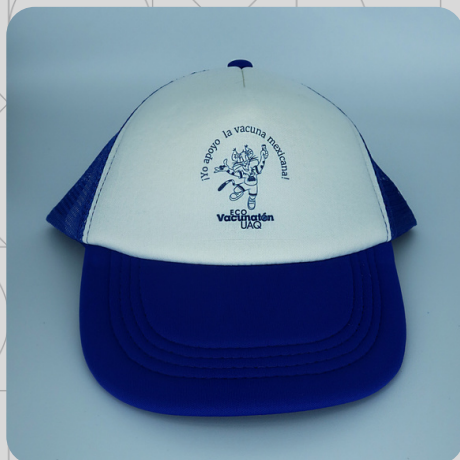
Modelo Color Azul Gato Azul