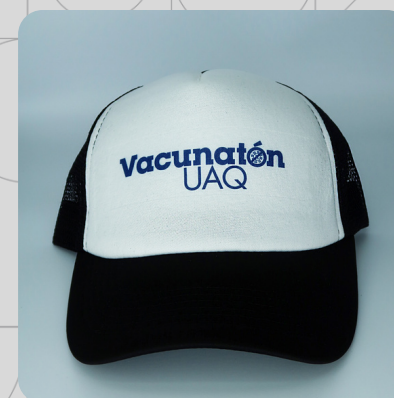
Adulto Negra Logo Azul