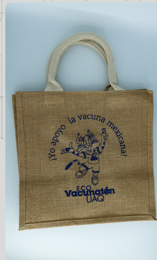
Bolsa Yute Gato