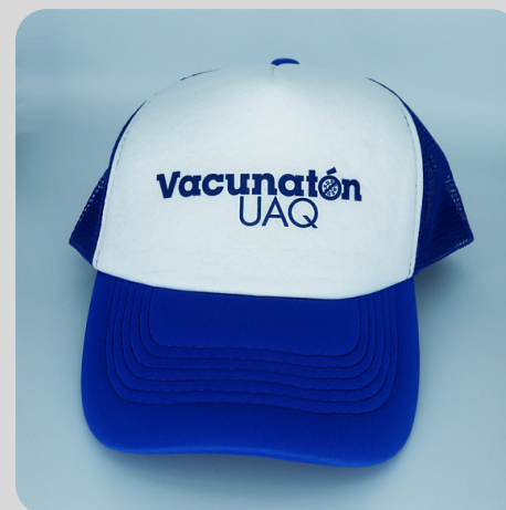
Modelo Color Azul Logo Azul