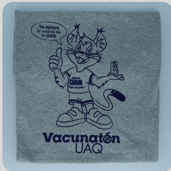
Modelo Gato Gris