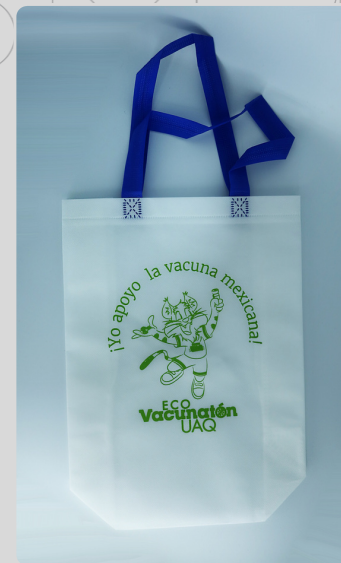
Bolsa Gato Verde