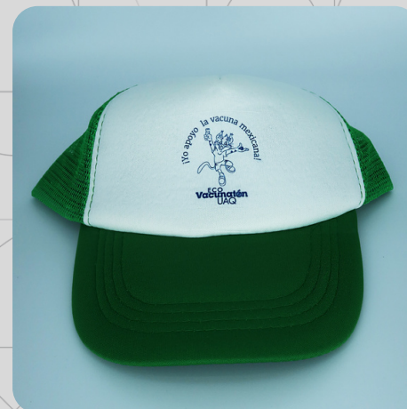
Modelo Color Verde Gato Azul