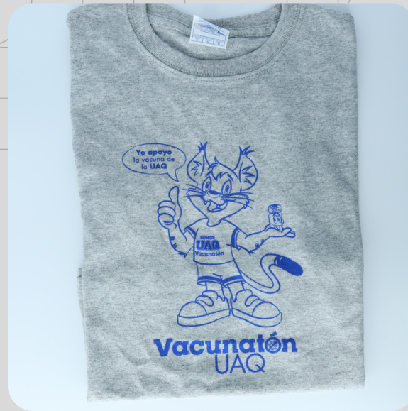
Modelo Gato Infantil