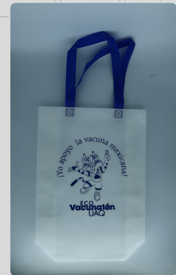
Bolsa Gato Azul