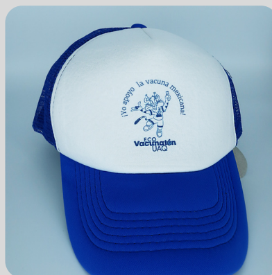
Adulto Azul Gato Azul