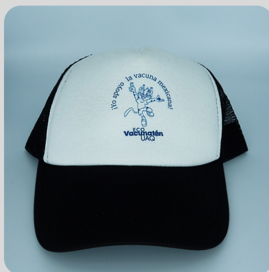
Adulto Negra Gato Azul