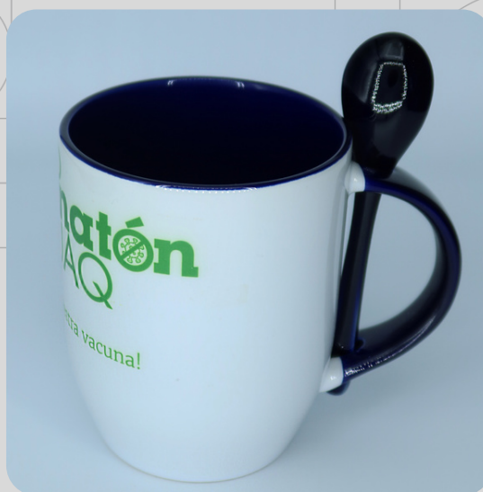
Taza Cuchara Logo Verde