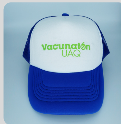
Adulto Azul Logo Verde