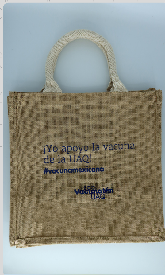
Bolsa Yute Texto