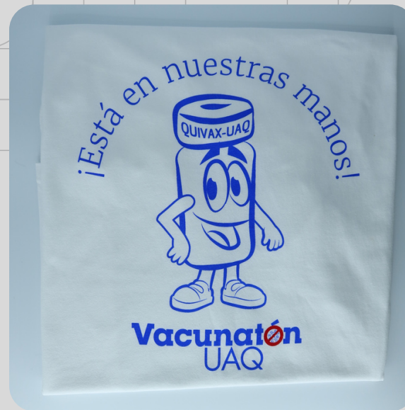
Modelo QUIVAX 17.4 Blanco