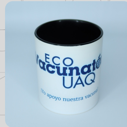
Taza Sencilla Logo Azul