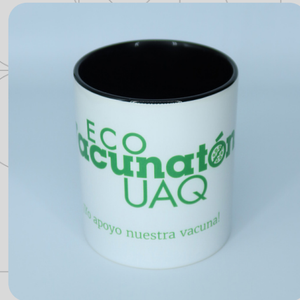
Taza Sencilla Logo Verde