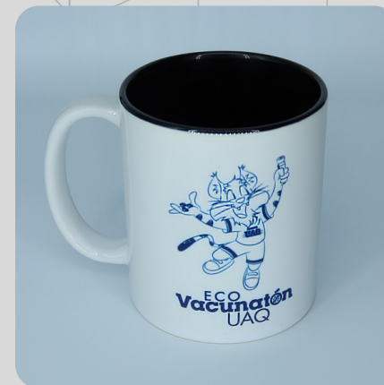
Taza Sencilla Gato Azul