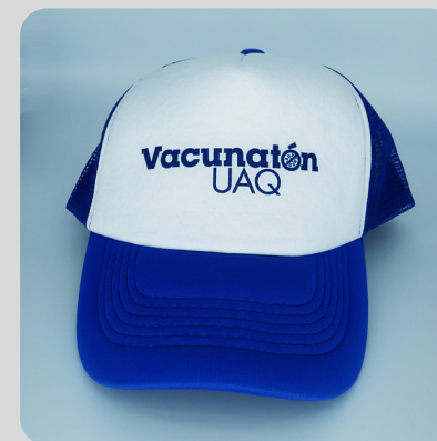
Adulto Azul Logo Azul