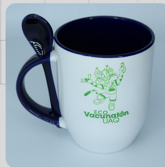
Taza Cuchara Gato Verde