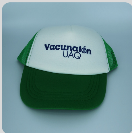
Modelo Color Verde Logo Azul