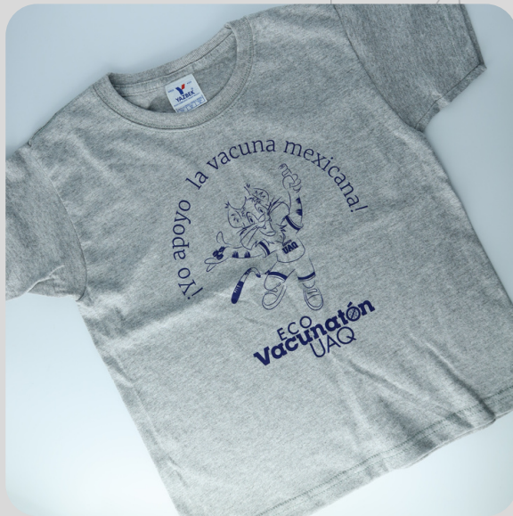
Modelo Eco Vacunación Infantill