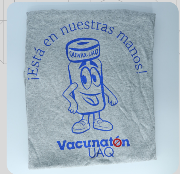
Modelo QUIVAX 17.4 Gris