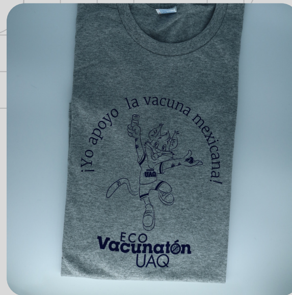
Modelo Eco Vacunación