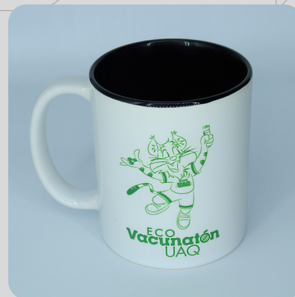
Taza Sencilla Gato Verde