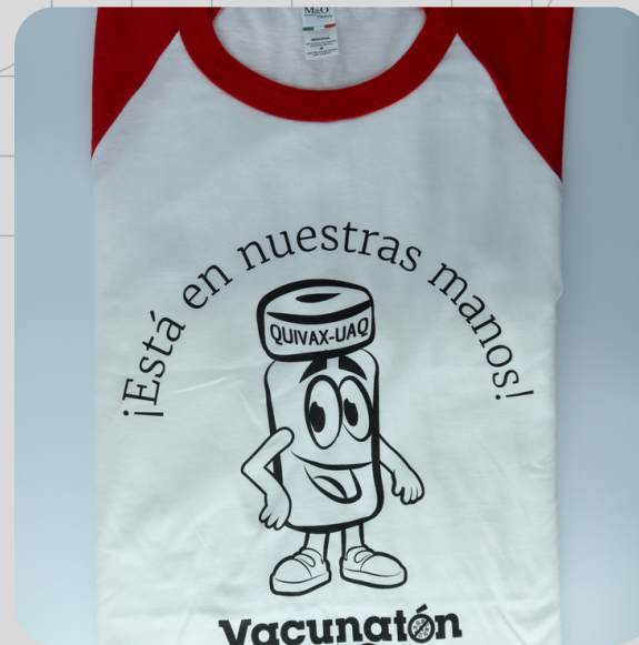
Modelo QUIVAX 17.4 Manga Roja